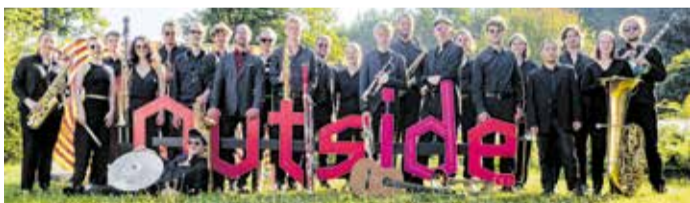
Gruppenbild des Jugendjazzorchesters Sachsen

Jugendjazzorchester Sachsen trifft Johannes Herrlich