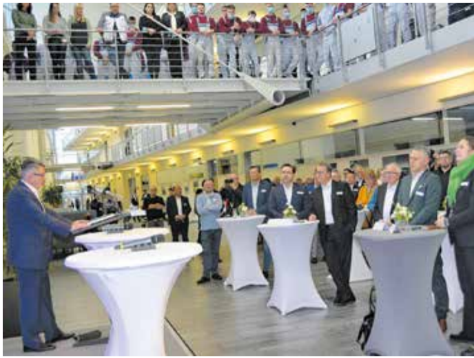
Mit einer Feierstunde wurde der Erweiterungsbau an der Reichenbacher Straße in Zwickau seiner Bestimmung übergeben.