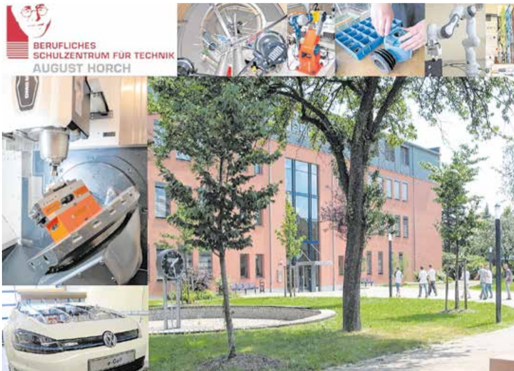
Ausbildung am BSZ „August Horch“ – ein Schritt in die berufliche Zukunft

Am Samstag, dem 4. Februar 2023 , wird das Berufliche Schulzentrum (BSZ) für Technik „August Horch“ in der Dieselstraße 17 in Zwickau von 9 bis 12 Uhr künftigen Schulabgängerinnen und -abgängern seine Türen öffnen. So können junge Leute, die nach einem Realschulabschluss oder einer abgeschlossenen Berufsausbildung den Erwerb der Fachhochschulreife im Bereich Technik anstreben, sich über diese Ausbildungsmöglichkeit sachkundig machen. Diese ist eine ideale Vorbereitung für ein Studium an einer Fachhochschule, wie an der Westsächsischen Hochschule in Zwickau.