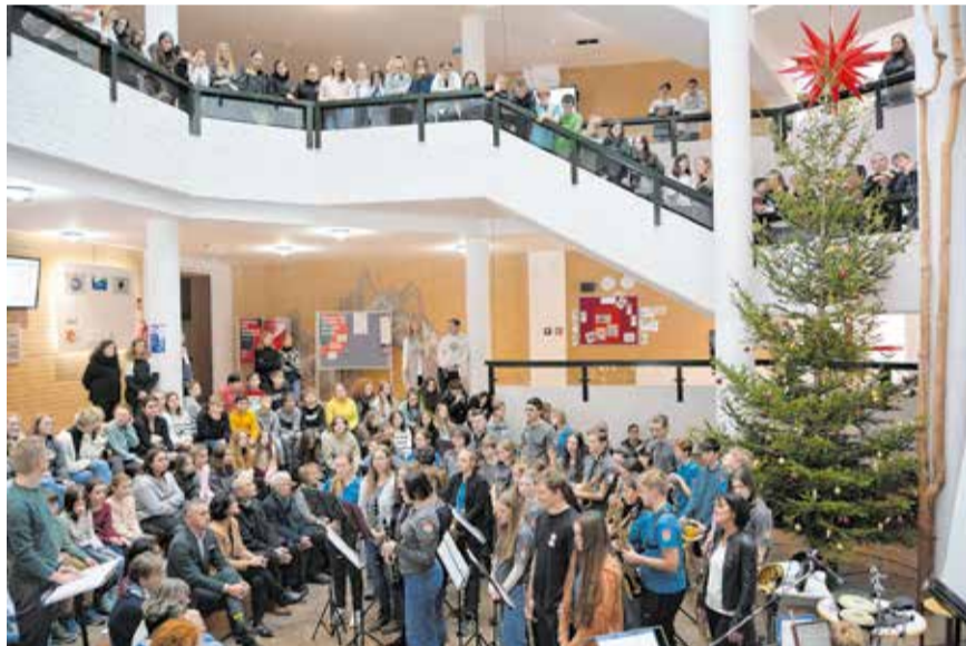
Interessiert verfolgten die Schülerinnen und Schüler den Festakt.

Insgesamt betrug der Kaufpreis 66.000 Euro. Davon wurden vom Freistaat Sachsen 26.000 Euro gefördert. Der Auftrag wurde im Dezember 2021 vergeben.