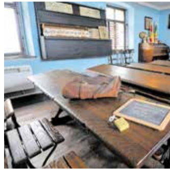
Blick in die Alte Dorfschule

Am Dienstag, dem 18. Oktober 2022 , finden Feriensonderführungen in der Alten Dorfschule von 10:00 bis 11:00 Uhr und 13:30 bis 14:30 Uhr sowie in der Bockwindmühle von 11:00 bis 12:00 Uhr und 14:30 bis 15:30 Uhr statt.