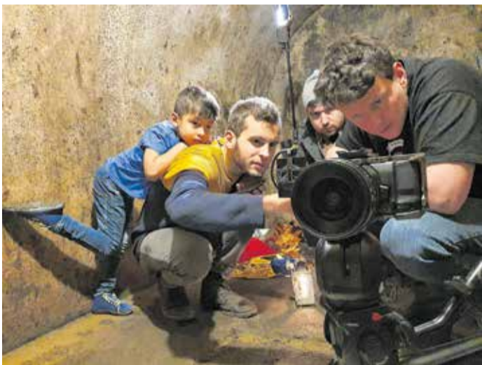
Beim Filmdreh des Imagefilmes

Anmeldung und weitere Informationen: www.fh-zwickau.de/kinderuni