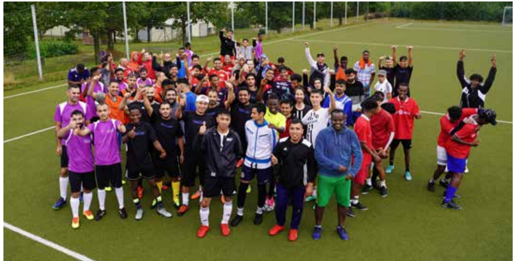
Die Mannschaften, die beim I-CUP 2022 teilgenommen haben.