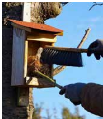
Reinigung eines Nistkastens