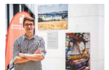
Wanderausstellung mit Bildern des Fotografen Oliver Göhler

Der Beigeordnete des Landkreises Zwickau, Carsten Michaelis, betont: „Ob der Schwanenteich in Zwickau, der Bismarckturm in Glauchau oder die Tuchfabrik Gebrüder Pfau in Crimmitschau – die Bilder zeigen die Vielfalt der Region, in der es so einiges zu entdecken gibt.“ Die Fotos in A1-Format wurden auf Alu-Dibond gedruckt. Göhler: „Die Wirkung der Bilder ist durch den metallischen Glanz eine ganz