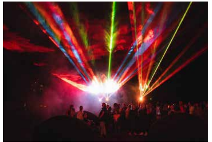
Nächtliches Treiben auf Schloss Waldenburg

Für die kleinen Schlossprinzessinnen und -prinzen gab es bei Spiel