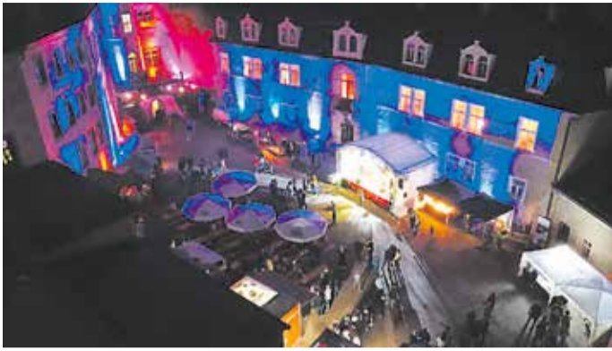
Schloss Wolkenburg