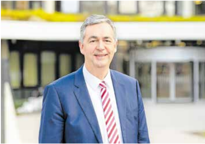
Landrat Dietmar Allgaier