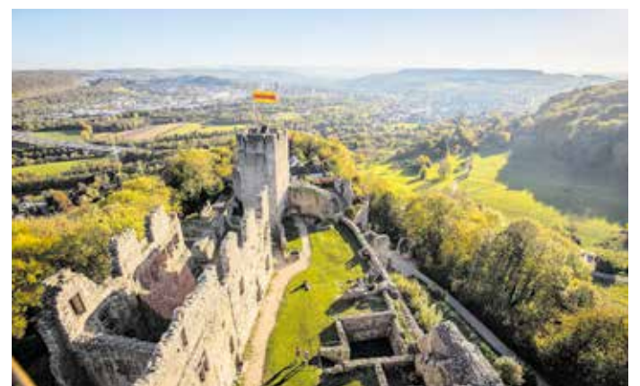
Burg Rötteln mit Blick auf den Landkreis