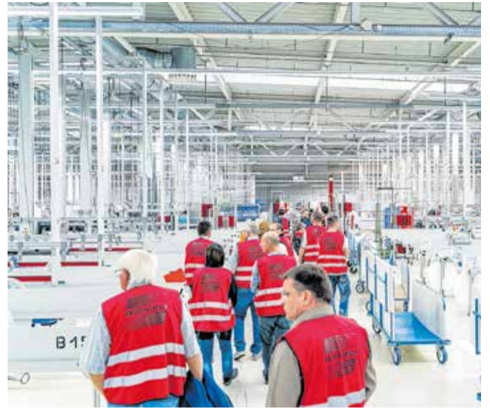
Die Fertigung von Außenjalousien und innenliegenden Sonnenschutzprodukten konnte bei der Spätschicht 2022 bei WAREMA in Limbach-Oberfrohna kennengelernt werden.

Aus dem Kreis Mittelsachsen ergänzen vier Unternehmen die Spätschicht.