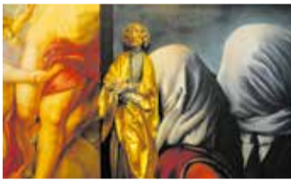
Am 10. September findet ein Vortrag Kunst-ARTen statt.

Ausgewählte Veranstaltungen im September