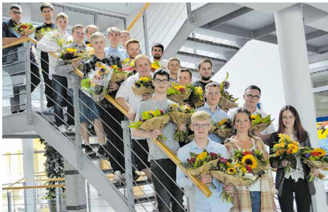
21 Azubis der „Grünen Berufe“ haben ihre Ausbildung erfolgreich abgeschlossen.

Am 20. Juli 2022 fand die diesjährige feierliche Zeugnisübergabe für die erfolgreichen Prüfungsteilnehmer in den Berufen Landwirt(in), Tierwirt(in) und Fachpraktiker(in) Landwirtschaft im Landratsamt des Landkreises Zwickau, Verwaltungszentrum Werdau, statt.