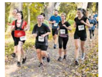
Herbstlauf 2022

Dort sind auch weitere Informationen zu den Startzeiten erhältlich.