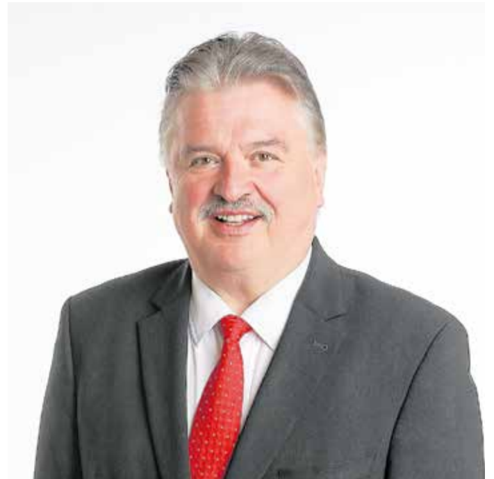
Landrat Klaus Peter Söllner

Ihr Klaus Peter Söllner Landrat des Landkreises Kulmbach