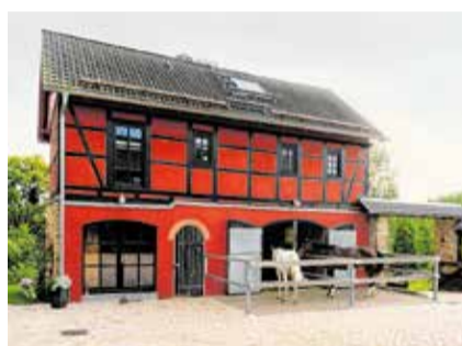
Umnutzung einer Scheune zu Wohnraum und für Stallung

Die LEADER-Region Schönburger Land lädt in Kooperation mit dem Denkmalnetz Sachsen und dem Zentrum für Baukultur Sachsen am Freitag, dem 1. September 2023 von 10:00 bis 17:00 Uhr zum Thementag „Scheune, Stall & Co.“ in den Lindenhof Niederfrohna, Obere Hauptstraße 6, 09243 Niederfrohna ein. Die Veranstaltung ist kostenlos.