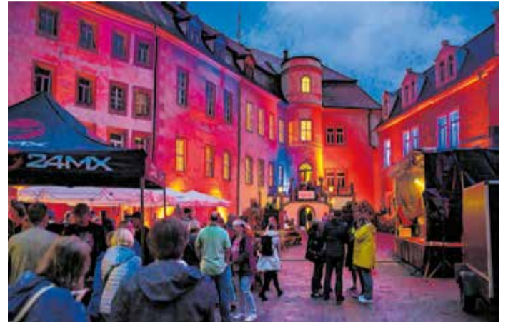
Nacht der Schlösser auf Schloss Wolkenburg

Übrigens: Bis 22 Uhr kann man das Schloss individuell besichtigen.