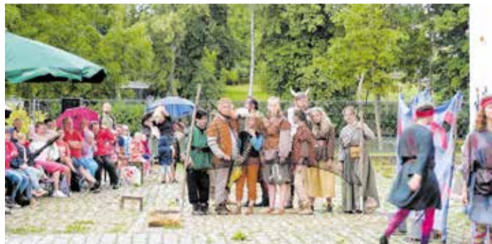
Die Naturbühne Trebgast begeisterte wieder die Zuschauer im Schloss Blankenhain.

Gastspiel der Naturbühne Trebgast im Schloss Blankenhain