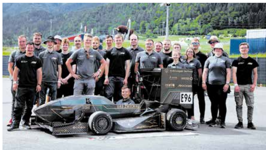
Das Racing Team

Diese tatkräftige Unterstützung erhält das WHZ Racing Team durch ihren Hauptsponsor Volkswagen Sachsen und der Westsächsischen Hochschule Zwickau (WHZ). Ohne diese wichtige Unterstützung wäre der Erfolg nicht möglich. Das Team profitiert dabei von der Entwicklung zum Elektromobilitätsstandort der Region Zwickau und dem breit aufgestellten Spektrum an Firmen in der Region, welche bei der Fertigung des Rennwagens unterstützen können. Das zeitintensive Hobby bringt auch den