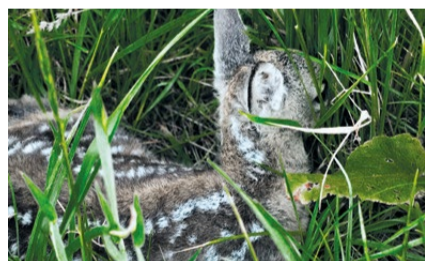
Ein Kitz versteckt im hohen Gras

Noch im Morgengrauen wurde die erste große Wiese mit der Drohne abgeflogen. Bereits bei der Ankunft sprangen zwei Rehe in den angrenzenden Wald ab. Auf der ersten Fläche zeigte die Wärmebildtechnik lediglich einen Dampspießler – faszinierend zu beobachten, für die eigentliche Kitzrettung jedoch nicht relevant. Als gegen 05:30 Uhr die zweite Wiese kontrolliert wurde, folgte der besondere Moment: Mitten im hohen Gras entdeckte das Team zwei Rehkitze. Es ist immer wieder beeindruckend, wie die Natur funktioniert. Die Ricke legt ihre Kitz im hohen Gras ab. In den ersten Lebens-