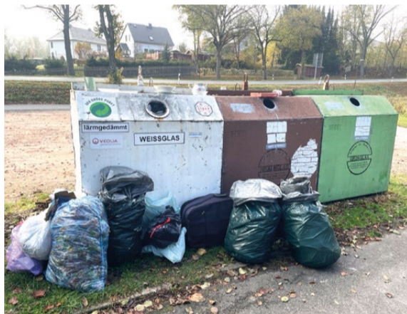
Abfälle gehören nicht auf oder neben die Container.

Abfälle gehören nicht auf oder neben Abfalltonnen und Container