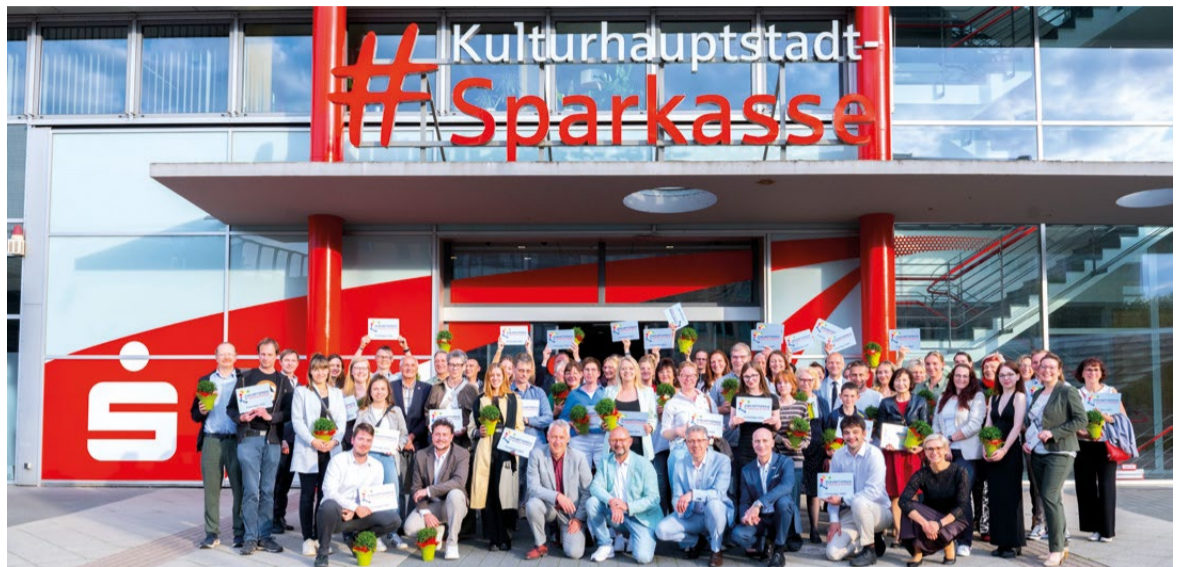
Gruppenbild der Preisträger vor dem Moritzhof in Chemnitz

Vom grünen Klassenzimmer bis zum Energiecampus – 39 Vorzeigeprojekte ausgezeichnet