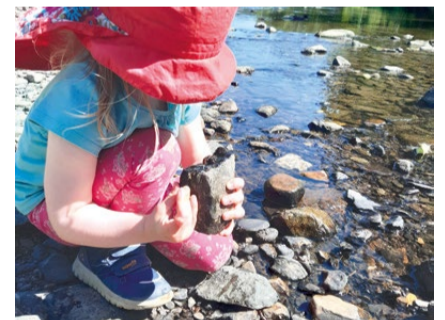
Bei einem genauen Blick ins Gewässer kann man vieles entdecken.

Bei den kleineren im Wasser lebenden Tie-