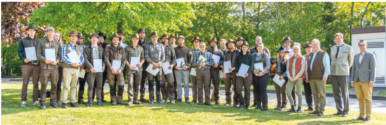
33 Prüflinge können sich jetzt offiziell Jungjägerinnen und Jungjäger nennen.

Erfolgreiche Jägerprüfung im Landkreis Zwickau würdigt Verantwortung, Tradition und Engagement