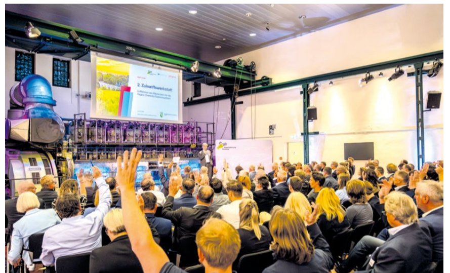
Rund 120 Expertinnen und Experten beraten darüber, wie aus strategischen Leitlinien konkrete Projektideen für die Zukunft der Region entstehen.

Zweite Zukunftswerkstatt bringt neue Projekte für die Region Chemnitz/Südwestsachsen auf den Weg