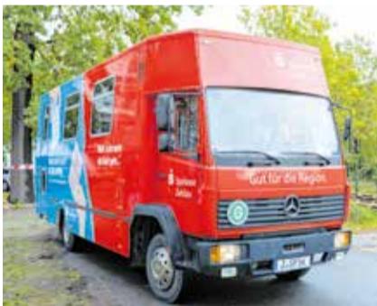
Das Führerscheinmobil des Landkreises Zwickau

Standorte des Umtauschmobils im Juli und August 2024