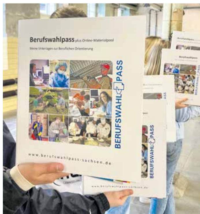
Schülerinnen und Schüler der Sahnsschule in Crimmitschau präsentieren den neu eingeführten Berufswahlpass.

Projekttag in Crimmitschauer Tuchfabrik Gebr. Pfau