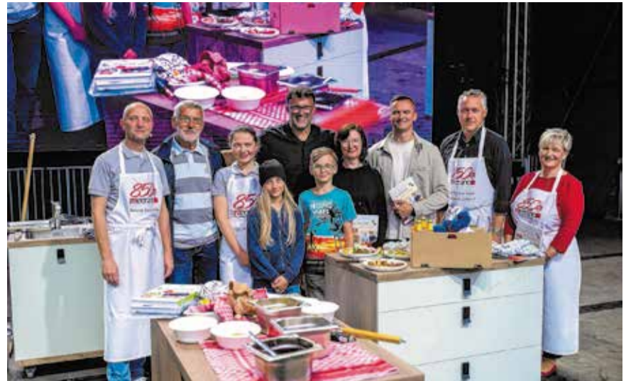
Die Teams des Kochduell

Gegrillte Köstlichkeiten beim Kochduell mit Tarik Rose