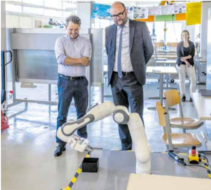
Kultusminister Christian Piwarz (r.) vor dem Leichtbauroboter „Panda“.

Kultusminister Christian Piwarz informierte sich zu Robotik