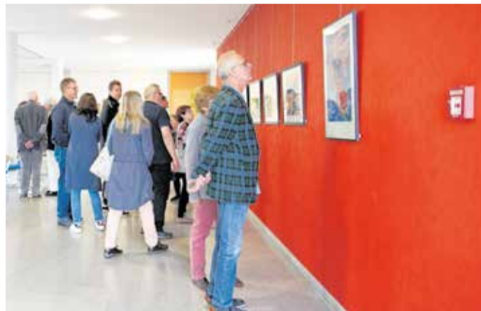
Zahlreiche Gäste kamen zur Eröffnung.