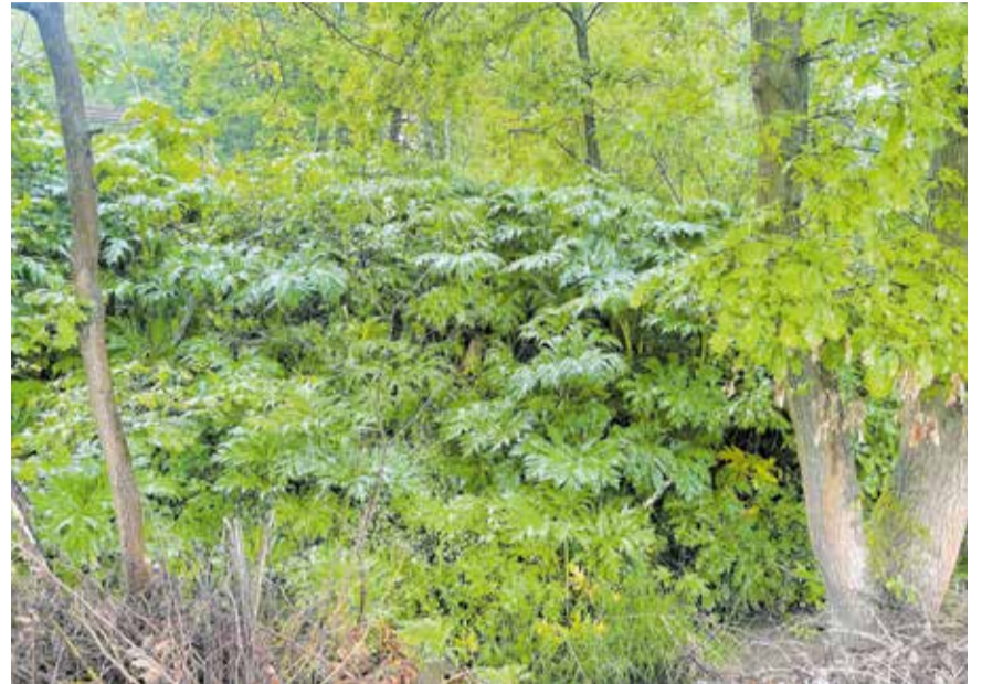
Der Riesen-Bärenklau

Der Riesen-Bärenklau ( Heracleum mantegazzianum ), auch Herkulesstaude genannt, stammt ursprünglich aus dem Kaukasus. Er wurde im 19. Jahrhundert als Zierpflanze nach Europa eingeführt und in Gärten und Parks weit verbreitet. Wegen seines Blütenreichtums wurde der Riesen-Bärenklau als Trachtpflanze für Honigbienen empfohlen und in der freien Natur durch Imker ausgesät. Die Jäger brachten ihn als Deckungspflanze für das Wild aus.