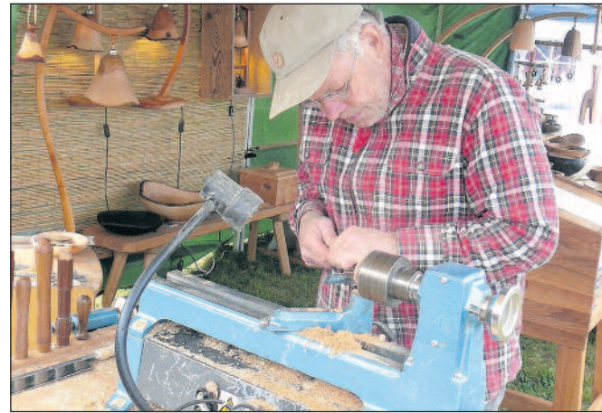
Schauvorführungen der Handwerker gehören zum Handwerker- & Töpfermarkt auf der Burg Schönfels dazu.