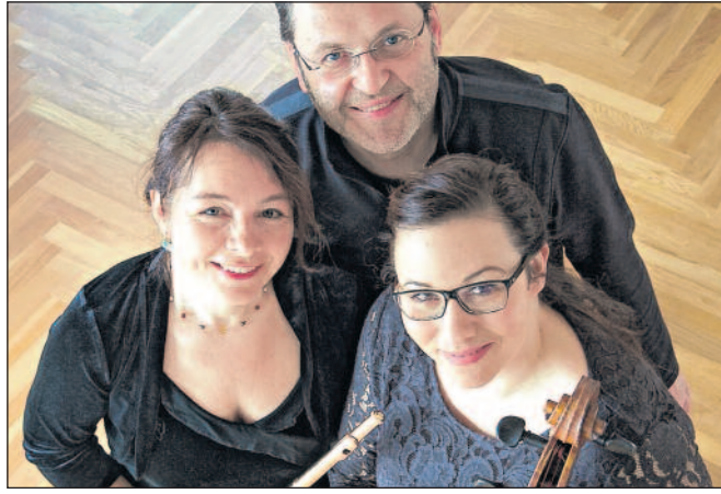
Ensemble Bento