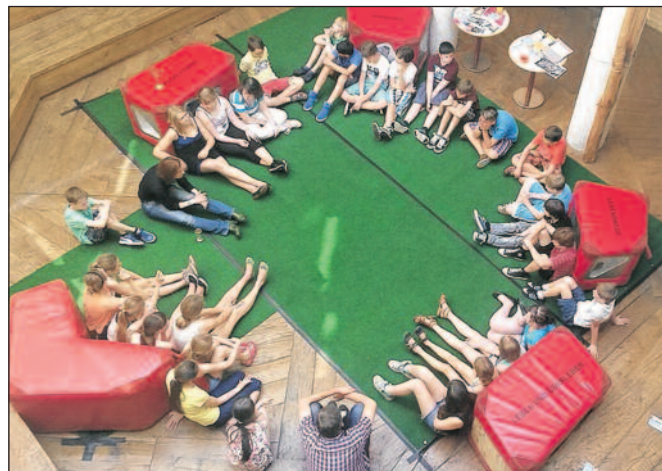
Noch lauschen die Schüler - gleich werden die Würfel auf eigene Faust erforscht.

Dabei setzt das Konzept der Wanderausstellung ganz auf die Neugier und Entdeckungsfreude der Kinder, welche die großen roten Lederwürfel, die auf jeder Seite ein anderes Exponat hinter Glas beherbergten, drehen und wenden konnten, um die Erklärung und Beschreibung selbst herauszufinden. So wurde jedes Kind als Teil seiner Gruppe zum Experten für einen Würfel und stellte seine Entdeckungen den anderen vor. Sie erfuhren viel Interessantes über jüdische Persönlichkeiten in Vergangenheit und Gegenwart, u. a. den Erfinder der Levis Jeans: Levi Strauss. Die Biographie von Gretel Bergmann, einer deutschen Hochspringerin mit jüdischen Wurzeln, deren Olympiahoffnung 1936 von den Nazis einfach sabotiert wurde, beeindruckte die Schüler sehr. Was ist eigentlich koscher? Warum und wie feiern jüdische