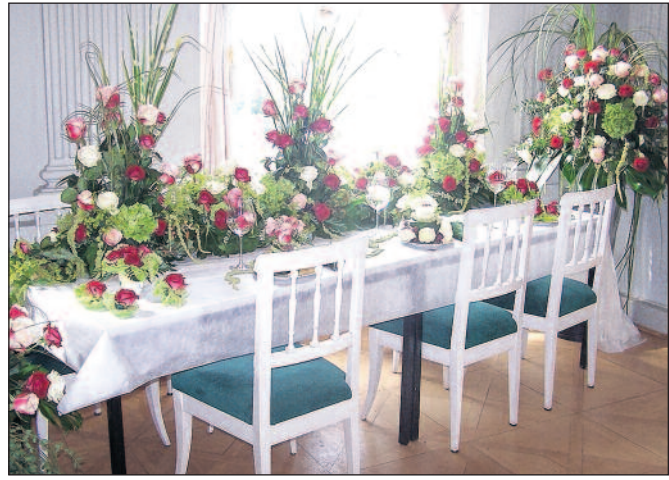
Verschieden arrangiert können die Besucher die Rose in ihrer Form und Vielfalt bewundern.

Den Schlosssaal werden die Floristinnen aus der Region mit verschie-