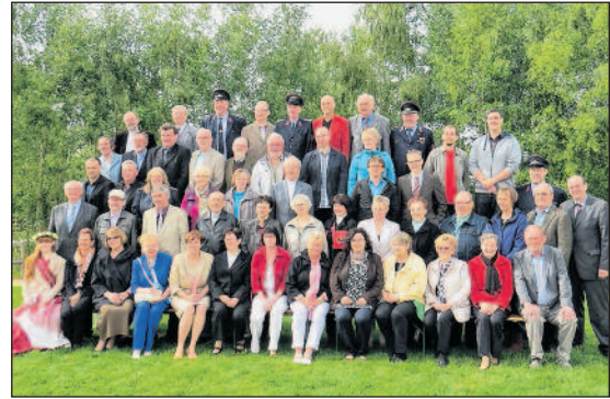
Impressionen der Festveranstaltung

Die Veranstaltung wurde unterstützt durch die Sparkasse Chemnitz.