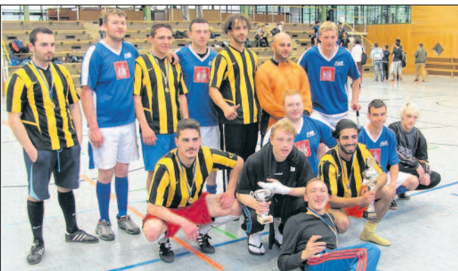
Die „Zwickauer Landkreiskicker“ (im blauen Trikot) gemeinsam mit dem Turniersieger, der Mannschaft der Mobilien Jugendarbeit Ludwigsburg

Auf Einladung von Landrat Dr. Rainer Haas aus dem Partnerlandkreis Ludwigsburg nahmen vom 9. bis 11. Mai 2014 erstmals Auszubildende des FAB Crimmitschau e. V. am MJA-Cup in Ludwigsburg teil. Dieses Fußballturnier für Freizeitmansschaften wird von den Streetworkern der Mobilien Jugendarbeit (MJA) Ludwigsburg organisiert und findet traditionell im Frühjahr statt.