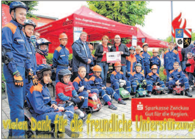
BobbyCar-Rennen der Kreisjugendfeuerwehren Zwickauer Land am 17. Mai 2014 in Werdau

So verwies das Team Stritzl die Jugendfeuerwehren aus Beiersdorf und Gospersgrün auf die hinteren