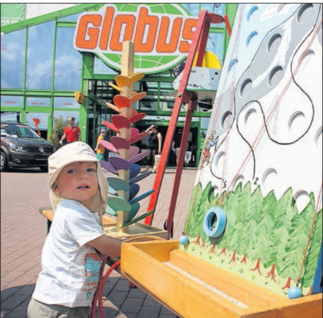
Das Kinder- und Familien-Sommerfest beim Globusmarkt in Zwickau verspricht Spaß, Spiel und Spannung.

Nachwuchsreporter und -fußballmannschaften gesucht