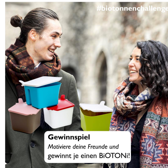
Tag 9 - Thema: Gewinnspiel und Freunde einbinden