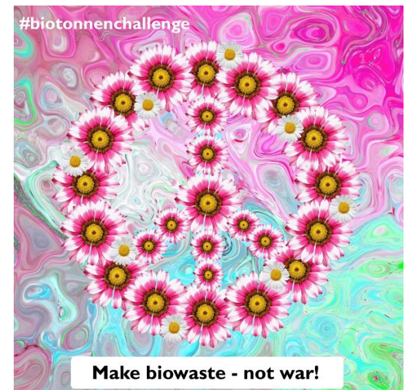
Tag 14 - Thema: Aktuelle Gasversorgung, Biogas und Biotonne