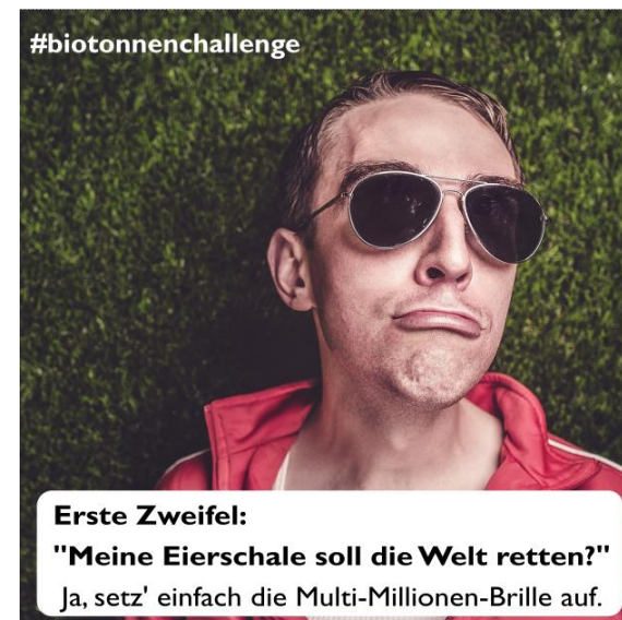
Tag 13 - Thema: Effektivität des persönlichen Handelns