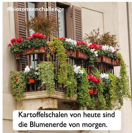
Tag 12 - Thema: Blumenerde vom Kompostwerk