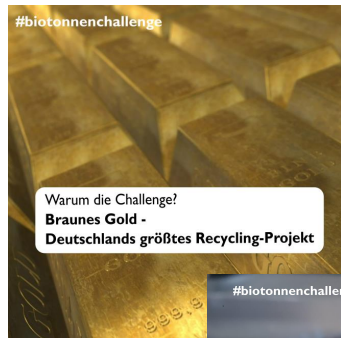
Tag 8 - Thema: Warum sammeln: Kompost & Biogas