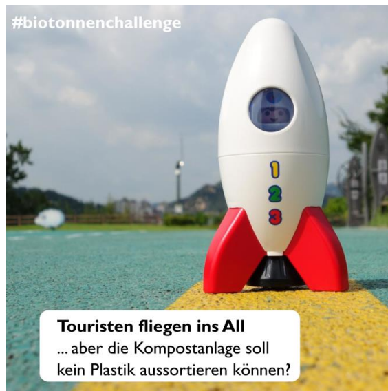
Tag 11 - Thema: Kein Plastik in der Biotonne