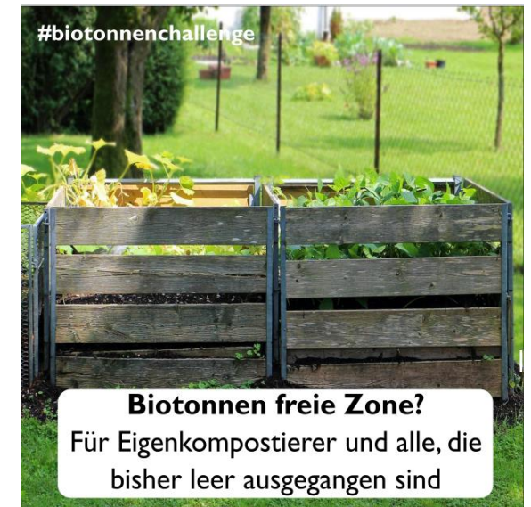
Tag 10 - Thema: Eigenkompostierer und Häuser ohne Biotonne