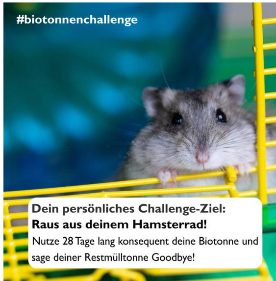
Tag 2 - Thema: Persönliches Ziel der Challenge