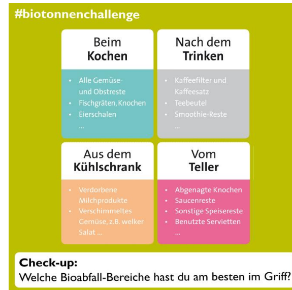
Tag 7 - Thema: Input in Lebenswelten-Kategorien