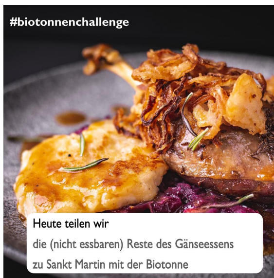
Tag 5 - Thema: Sankt Martin am 11. Nov