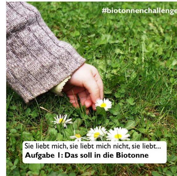
Tag 3 - Thema: Was darf in die Biotonne?