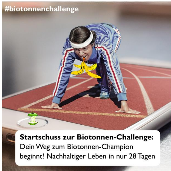
Tag 1 - Thema: Start der Challenge