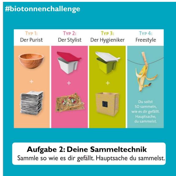
Tag 4 - Thema: Wie sammle ich?